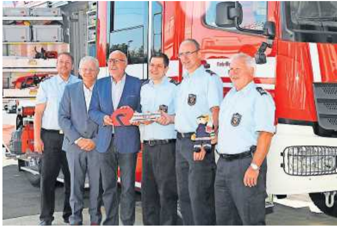
Das neue HLF20 wurde offiziell übergeben.