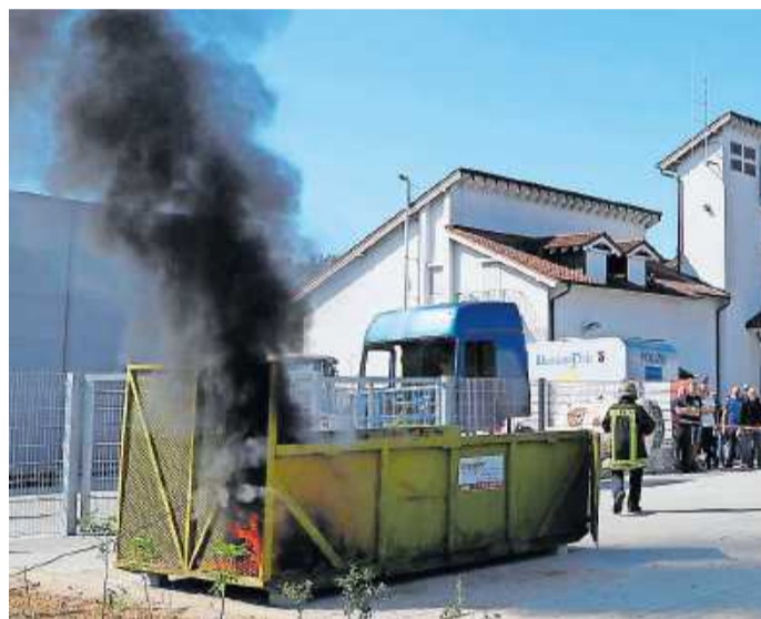
Am Tag der offenen Tür gab es viele Informationen und Vorführungen, hier eine Fettexplosion.

erwehr unter anderem den Neubau zu besichtigen. Darüber hinaus wurde an diesem Tag ein neues Einsatzfahrzeug seiner Bestimmung übergeben, HLF20. Es bietet Platz für neun Einsatzkräfte und beinhaltet einen kompletten Rettungssatz für die technische Hilfe, Material für die Brandbekämpfung, Atemschutzgeräte, Spezialwerkzeuge für die Öffnung von Türen, Wärmebildkamera und einen Löschwassertank von 2000 Litern für den Erstangriff bei einem Brandereignis. Ersetzt wurde damit ein 29 Jahre altes Löschgruppenfahrzeug. Zu den Anschaffungskosten von 353.442 Euro ist eine Landeszuwendung von 119.000